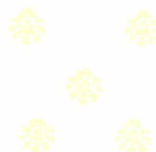
Lauro Adolfo Maia Serafim Prefeito Constitucional

Gabinete do Prefeito Constitucional de Catolé do Rocha – PB, em 21 de outubro de 2022.