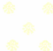
Lauro Adolfo Maia Serafim Prefeito Constitucional

Gabinete do Prefeito Constitucional de Catolé do Rocha – PB, em 02 de março de 2022.