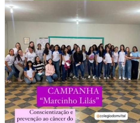
CAMPANHA “Marcinho Lilás”