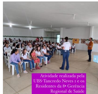
Atividade realizada pela UBS-Tancredo Neves 1 e os Residentes da 8ª Gerência Regional de Saúde