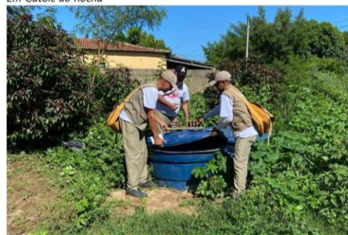
AGENTES MUNICIPAIS DE ENDEMIAS SEGUEM NO COMBATE AO MOSQUITO