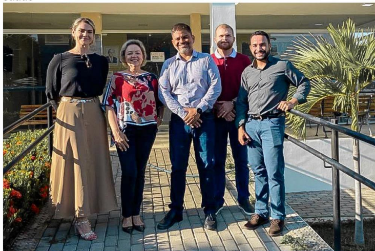
TÉCNICOS DA SIEMENS BRASIL EM VISITA ONTEM À SMS