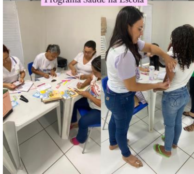
Programa Saúde na Escola