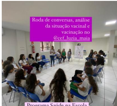
Roda de conversas, análise da situação vacinal e vacinação no @cef_luzia_maia