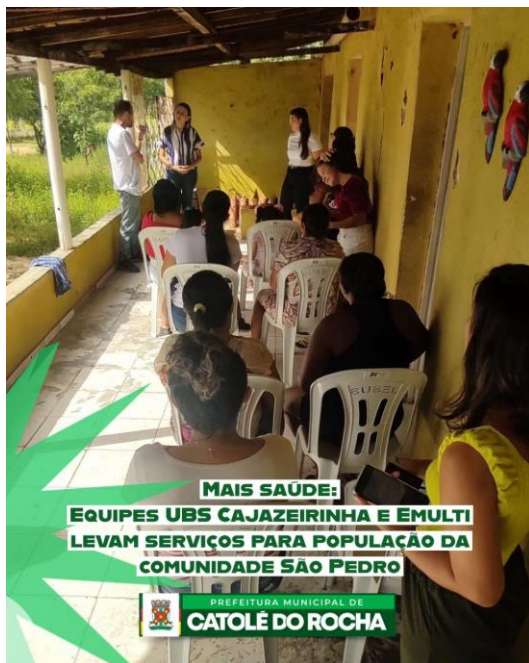
MAIS SAÚDE: EQUIPES UBS CAJAZEIRINHA E EMULTI LEVAM SERVIÇOS PARA POPULAÇÃO DA COMUNIDADE SÃO PEDRO